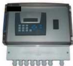
Version boîtier plastique